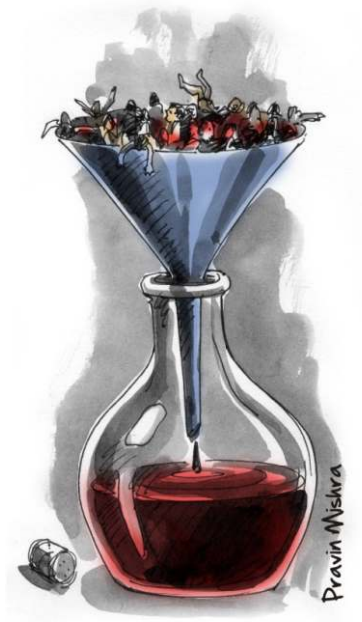
પ્રચંડ નાણાં બનાવવા કરે છે.

આજ પ્રમાણે, SEZને કારણે સાચો માળખાગત વિકાસ જોયો નથી સિવાય કે- સ્થાવર મિલકતનો વિકાસ અને વાયદાઓનો વેપાર. વિવિધ વિસ્તારોમાંથી એવો અહેવાલો આવ્યા છે કે જમીન માફીયાઓ SEZનો ઉપયોગ અતિ ઊંચા ભાવે સ્થાવર જમીનો વેચીને