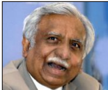
નરેશ ગોયલ, ચેરમેન, જેટ એરવેઈઝ

ગત વર્ષે ડીસેમ્બર મહિનામાં જેટ એરવેઈઝનાં સંચલકોએ તમામ કક્ષાનાં કામદારોને સ્વેચ્છિક રીતે પગાર-ભથ્થામાં કાપ સ્વીકારવા આહવાન કરેલ. અમુક કક્ષાનાં કામદારોએ તેનો સ્વીકાર કરેલ. જેટ એરવેઈઝનાં પાયલોટો (વિમાન ચાલકો) એ વખતે ભારતીય વિમાન ચાલકો, પાયલોટોનાં કલ્યાણ માટે રચેલ મંડળી નામે સોસાયટી ફોર ઇવેલ્ફર ઓફ ઈન્ડિયન પાયલોટ્સ (SWIP) હેઠળ સંગઠીત હતાં. સ્વીપે મેનેજમેન્ટને જણાવેલ કે જો વિદેશી પાયલોટો (વિમાન ચાલકો) ને દુર કરવામાં આવે તો પાર્શ્વલોટો પગાર ભથ્થામાં વાજબી કાપ સ્વીકારવા તૈયાર છે. જેટ એરવેઈઝ બન્ને ભારતીય અને આંતર-રાષ્ટ્રીય વિમાન ચાલકોની ભરતી કરે છે. પણ તેઓ ભારતીય વિમાન